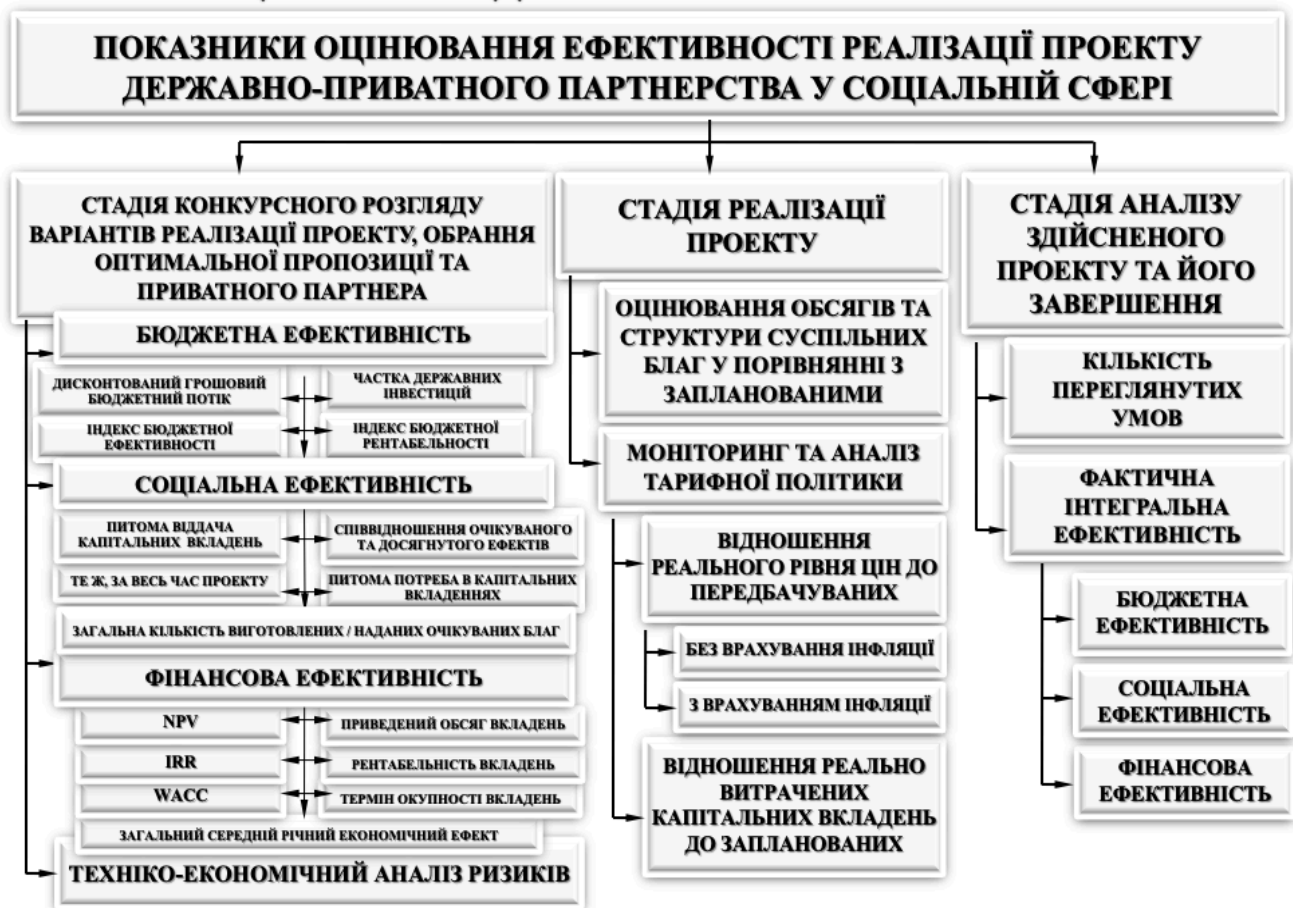
Рис. 3. Показники оцінювання ефективності проектів державно-приватного партнерства у соціальній сфері інноваційної системи

Аргументовано доцільність доповнення розрахунку показників ефективності реалізованих проектів державно-приватного партнерства у соціальній сфері оцінними процедурами на стадіях обґрунтування, поточної реалізації, підсумкового аналізу проектів партнерства (рис. 3).