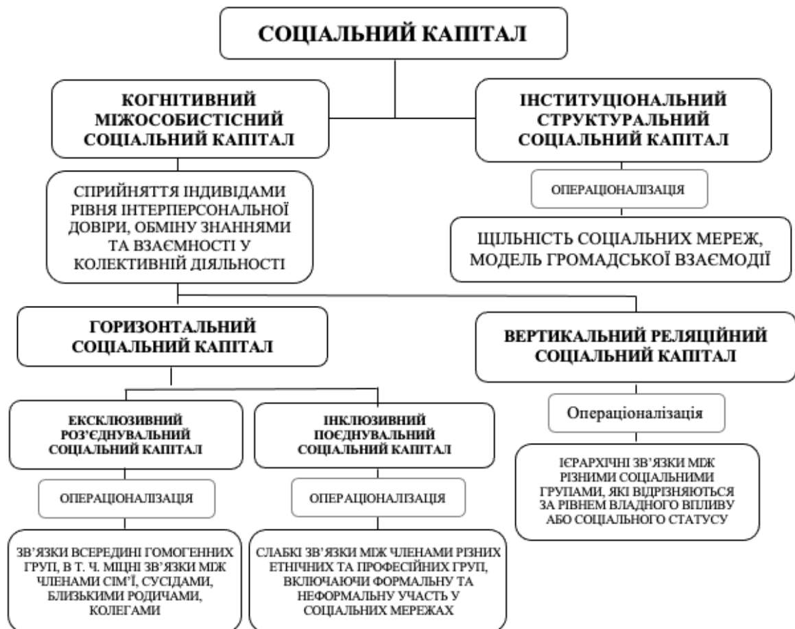
Рис. 1. Двокомпонентна структура соціального капіталу національної економіки

Характеристиками соціального капіталу (рис. 1) як нематеріальної, структурованої у відносинах інституціональних агентів екосистем комунікативної діяльності визнано обмежений ступень поширення, здатність до часткового відчуження, пріоритетність інновативного інвестування розвитку соціальних мереж, здатність забезпечувати стабільний дохід персональних носіїв у тривалій перспективі, потужність генерувати додану вартість у процесі колективної співпраці, схильність до самозростання, спроможність як специфічної форми активу спільного користування забезпечувати персональний та колективний добробут членів суспільства.