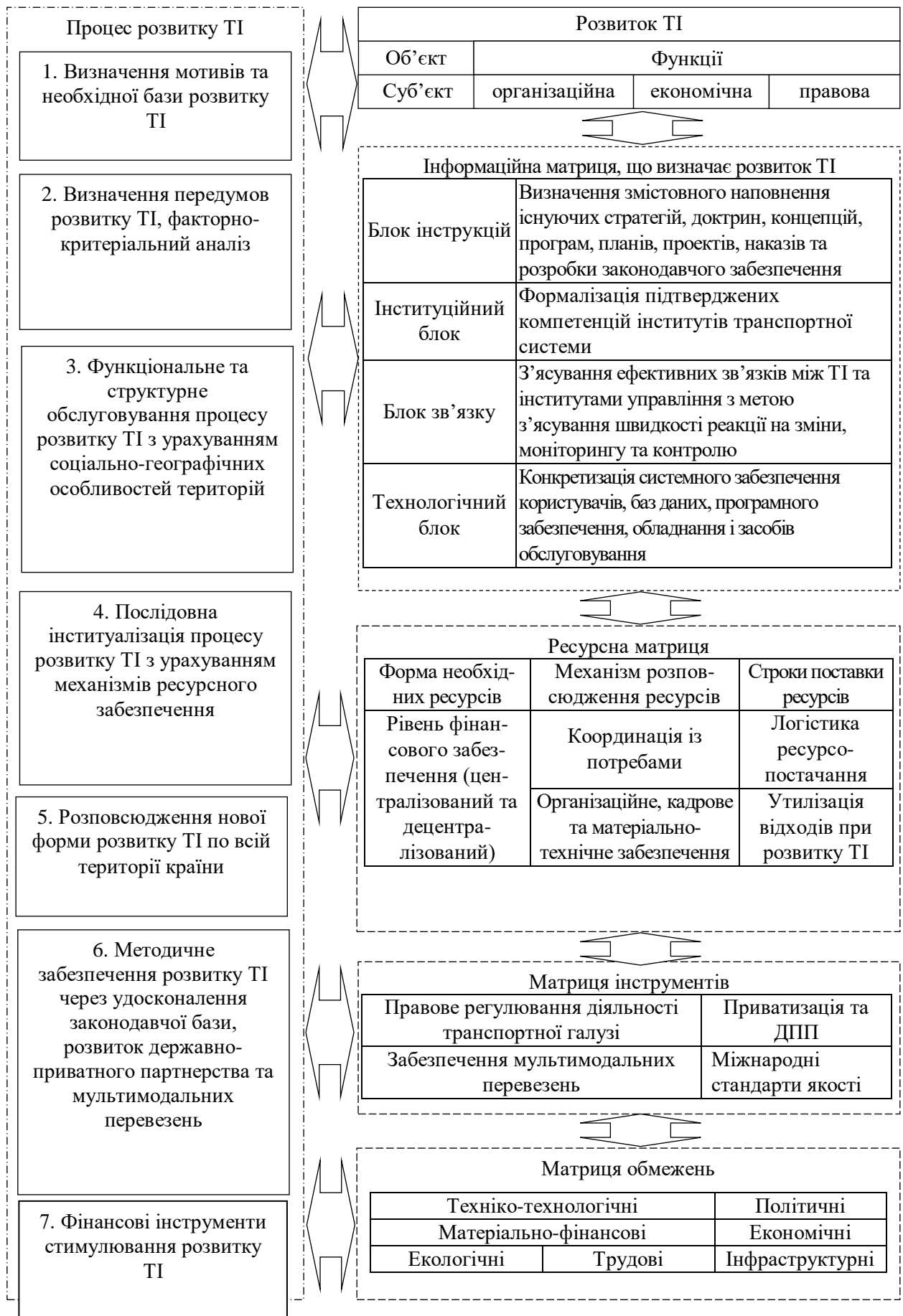
Рис. 2. Механізм розвитку національної транспортної інфраструктури (ТІ)