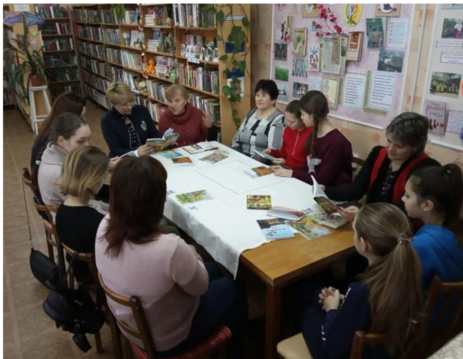
Рис.2. Літературна студія «Світанок»