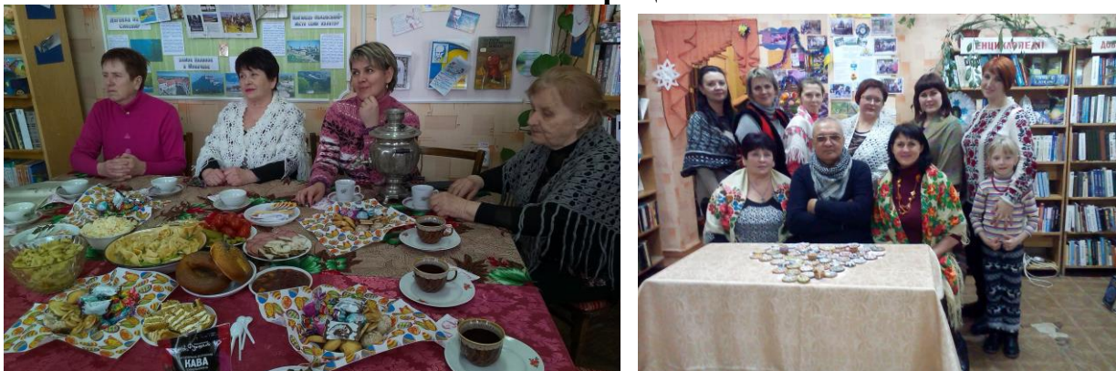
Рис.1. На засіданні клубу «Світана»