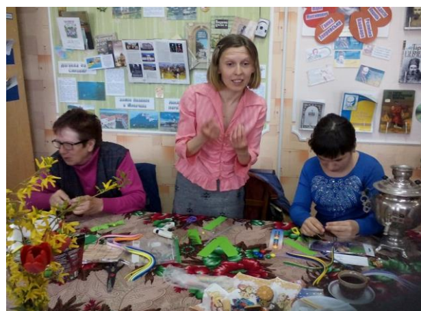
Рис.3. Проведення майстер-класів