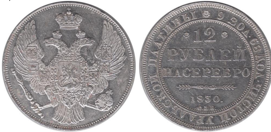
Рис. 1. Російська імперія, Микола I (1825 – 1855). 12 рублів 1830 р., м.д. Санкт-Петербург. ОАМ. Інв. № 52369.